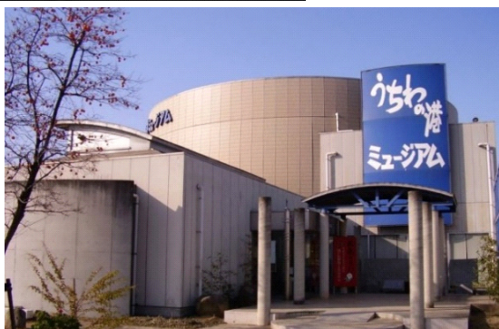
◀うちわの港ミュージアム